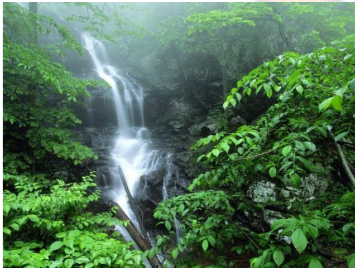
Virginia Beach (上右)

Shenandoah National Park 位于夏市以北，约半小时车程。园区被天际线公路 (Skyline Drive) 所贯穿，南北向约百英里长。公园主要地貌为山谷及森林。园区内有一个总统度假山庄。罗斯福年代的总统们喜欢来此处休闲，地以人贵，因此成名。其景色以春秋最佳，适合 Hiking, Camping。